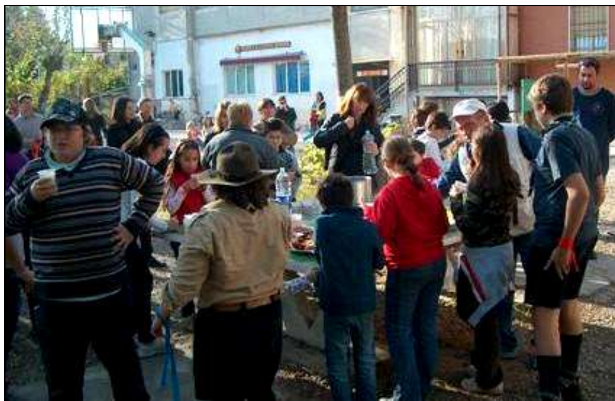
... e per finire una "CIOKKOLATATA" calda e fumante ...