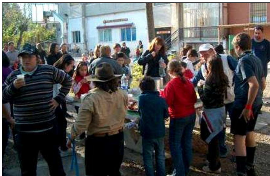
... e per finire una "CIOKKOLATATA" calda e fumante ...