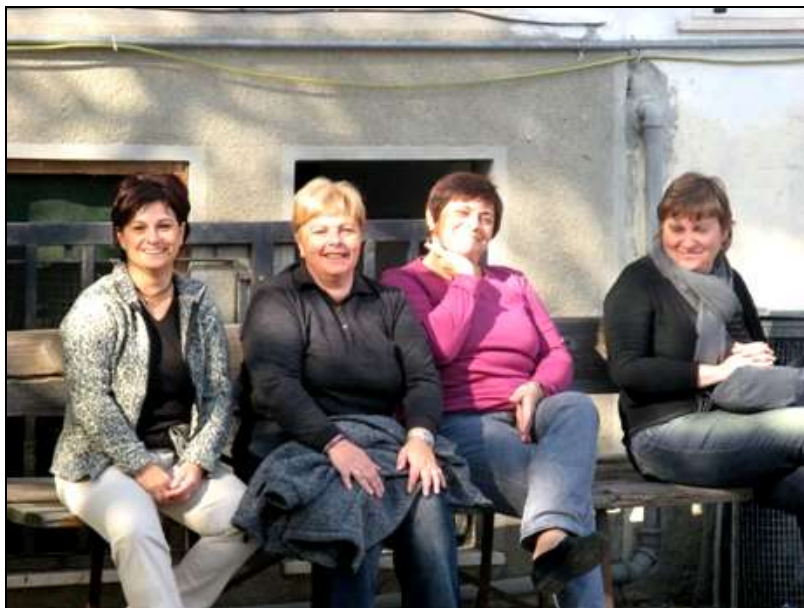
mamme "in" posa