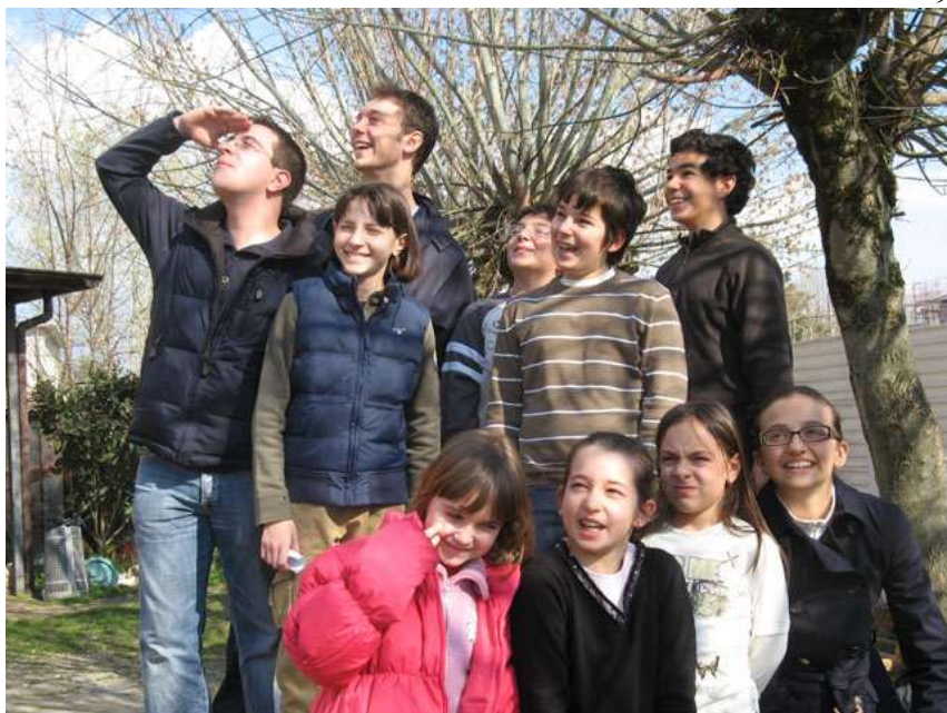
Il gruppo di qualche anno fa in una bella immagine

un gruppo che sa guardare in alto ma anche in avanti... - in alto perche c'è Lui che ci da la strada - e in avanti perché bisogna saper passare le cosiddette consegne a chi verrà dopo di noi, ai più piccoli