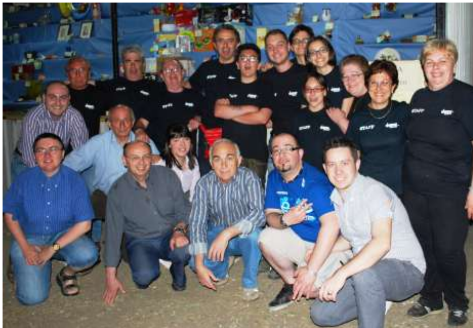
una parte dello staff di battuinfesta 2010