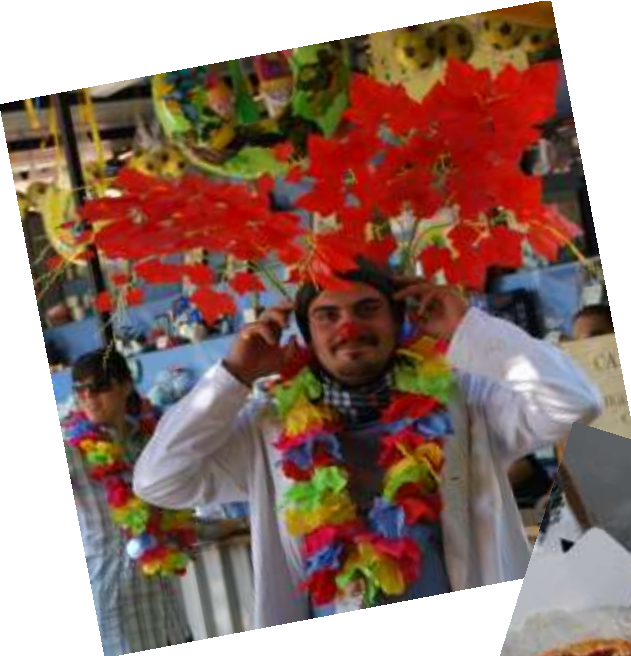
i clowns del pomeriggio della domenica